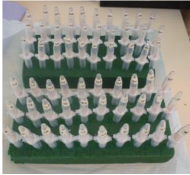
Fig. 3 Modelo de doble cámara