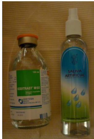
Fig.4 Medio de contraste Ioditrast® M60 y saliva artificial Viarden