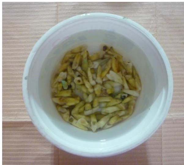
Fig.1 Dientes uniradulares en hipoclorito de sodio al 6%.

Los dientes se sumergieron en 6% de hipoclorito de sodio (NaOCl) por 15 minutos, para remover restos de material orgánico de la superficie radicular.