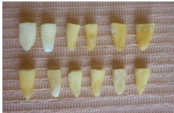
Fig. 3 Raíces de 13mm de longitud

Para la preparación biomecánica del conducto, se determinó la longitud de trabajo utilizando limas # 15, K-Flexofile (Dentply Maillefer), las cuales se introdujeron hasta sobrepasar ligeramente el ápice restando 1 mm a la medida anterior. Después se empleó el sistema rotatorio ProTaper, la preparación apical se llevó a cabo hasta una lima # 40 para estandarizar el diámetro apical. Se utilizaran instrumentos nuevos cada 10 conductos preparados.