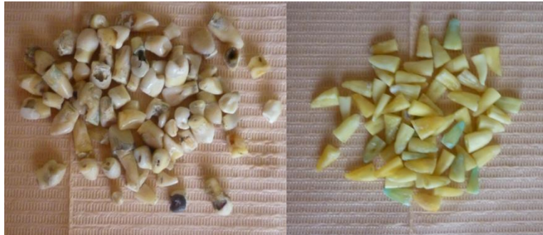
Fig. 2 Dientes cortados con disco de carburo

Se cortaron con un disco de carburo en el tercio coronario de la raíz, a una longitud radicular aproximada de 13 mm, para mantener uniformidad en la longitud de las muestras.